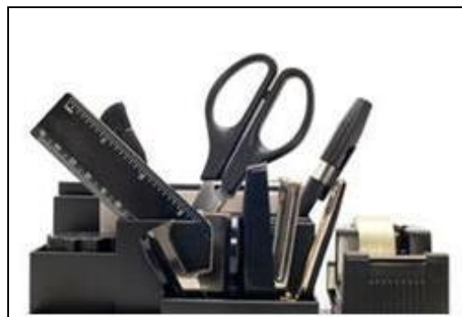
[@Zeta Pro Office]

Powierzchnia magazynu firmy to 1200 m 2 . W magazynie zatrudnionych jest 9 osób.